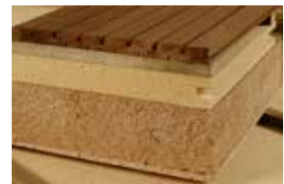
CHOIX DES MATÉRIAUX