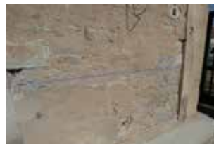
PRISE DE COTES