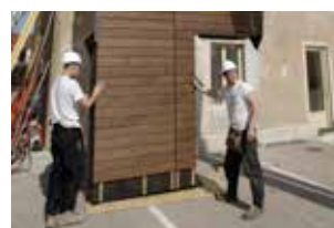
POSE SUR SITE